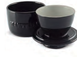
Manteigueira Francesa | Home