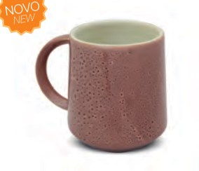
Caneca | Brisa LISA