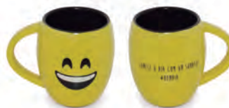
Caneca Cônica Diverticon #BOM DIA