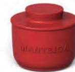
Manteigueira Francesa | Home