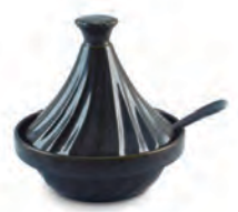
Saleiro Mini Tagine com colher | Twist