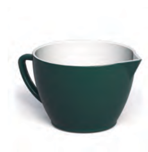
Bowl de Preparo

O Bowl de Preparo Ceraflame é a escolha perfeita para facilitar os preparos na cozinha. Com bico e alça ergonômica, ele oferece praticidade ao misturar, servir e transferir ingredientes com precisão. Com capacidade de 2 litros, é ideal para o preparo de massas, misturas e receitas variadas, sendo um aliado indispensável para quem valoriza funcionalidade e design.