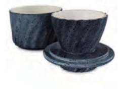
Manteigueira Francesa | Twist