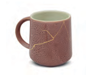
Caneca | Brisa OURO

PEÇAS COM DETALHE EM OURO | não levar ao micro-ondas