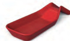
Descanso para colher reto | Home