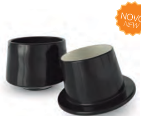
Manteigueira Francesa | Brisa LISA