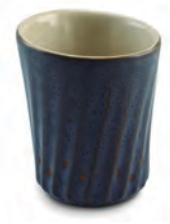
Porta Utensílios Twist