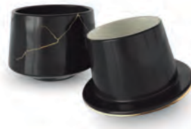
Manteigueira Francesa | Brisa OURO