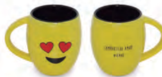
Caneca Cônica Diverticon #AMOR