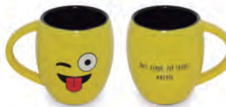
Caneca Cônica Diverticon #HUMOR