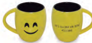
Caneca Cônica Diverticon #FELICIDADE