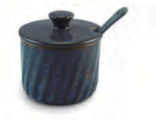
Açucareiro com colher | Twist