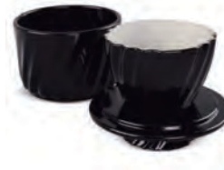
Manteigueira Francesa | Twist