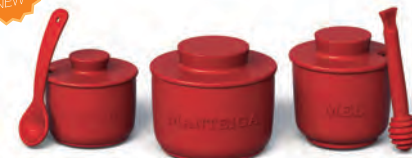
Conjunto Mesa Posta 3 peças | Home

Açucareiro com colher 150g, manteigueira francesa 250g e pote de mel com colher 250g