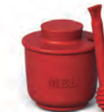
Pote de Mel com colher | Home