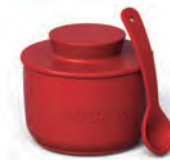
Açucareiro com colher | Home